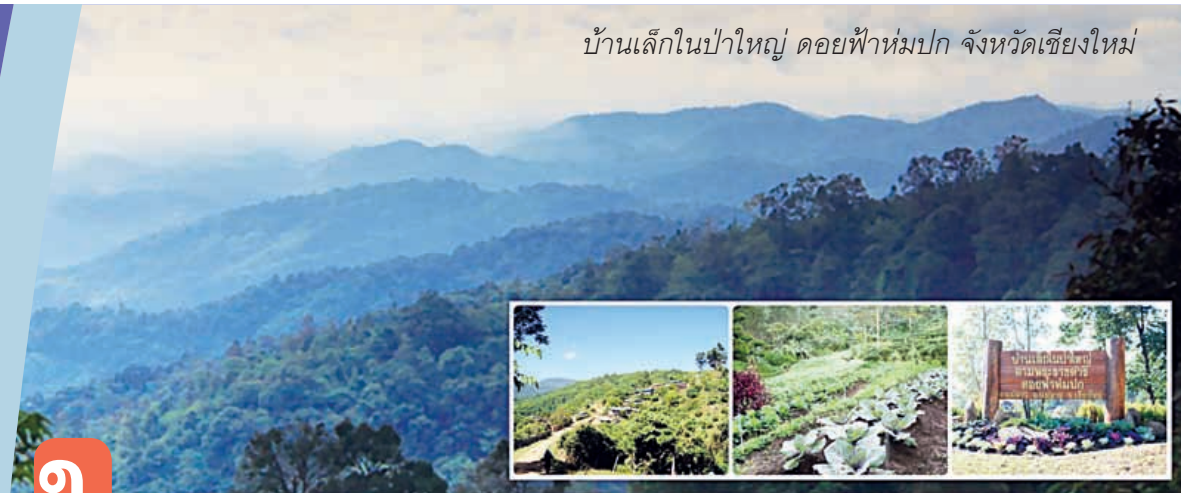
บ้านเล็กในป่าใหญ่ โดยฟ้าห่มปก จังหวัดเชียงใหม่

ในเดือนกันยายนนี้ซึ่งเป็นเดือนสุดท้ายของปีงบประมาณ ๒๕๕๗ นี้ซึ่งเป็นช่วงที่ทุกหน่วยงานรับดำเนินงานให้แล้วเสร็จตามแผนประจำปี และในเดือนนี้ตรงกับวันที่ ๙ กันยายน เป็นวันเกิดของสำนักงาน กปร. ด้วยโดย สำนักงาน กปร. ก่อตั้งตามระเบียบสำนักนายกรัฐมนตรีว่าด้วยโครงการอันเนื่องมาจากพระราชดำริเมื่อปี ๒๕๒๔ มีหน้าที่เป็นหน่วยงานกลางในการสนองพระราชดำริเพื่อจัดทำโครงการอันเนื่องมาจากพระราชดำริ ปัจจุบันมีอายุมา ๓๓ ปีแล้ว ซึ่งเจ้าหน้าที่สำนักงาน กปร. มีความภาคภูมิใจที่ได้รับภารกิจที่สำคัญนี้ และได้ร่วมแรงร่วมใจกันทำงานที่สำคัญนี้ด้วยความมุ่งมั่นทุ่มเทโดยตลอด และมีความตั้งใจที่จะสนองงานอย่างเต็มความสามารถเพื่อให้พระราชดำริของทุกพระองค์สามารถช่วยเหลือราษฎรในพื้นที่ต่างๆ ได้อย่างรวดเร็ว