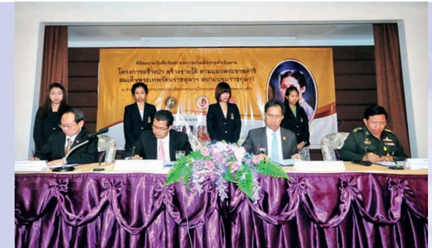
วันที่ ๓ กันยายน ๒๕๒๗ พิธีลงนามบันทึกข้อตกลงความร่วมมือการดำเนินงานโครงการสร้างป่า สร้างรายได้ ตามแนวพระราชดำริ สมเด็จพระเทพรัตนราชสุดาฯ สยามบรมราชกุมารี ระหว่างสำนักงาน กปร. - กรมป่าไม้ - กรมการปกครอง - กอ.รมน.

องค์ความรู้ที่ศูนย์ศึกษาฯ ทั้ง ๖ แห่งได้ทำการศึกษาและจัดทำเป็นข้อมูลนั้น สำนักงาน กปร. ได้สนับสนุนให้เกิดการถ่ายทอดให้กับผู้ที่สนใจให้มากขึ้น โดยแต่เดิมอาจจะเน้นที่ประชาชนในพื้นที่รอบศูนย์ศึกษาฯ ต่อมาสำนักงาน กปร. ได้ร่วมกับเครือข่าย เช่น กระทรวงมหาดไทย ให้ทุกจังหวัด ๗๖ จังหวัด นำเกษตรหรือประชาชนที่สนใจได้รับการอบรม รุ่นละ ๑๐๐ คน เพื่อนำความรู้ที่พัฒนาอาชีพในด้านต่างๆ รวมทั้งได้รับการทรงงานของพระบาทสมเด็จพระเจ้าอยู่หัว ได้สัมผัสของจริงในพื้นที่ที่พระองค์ได้ทรงงาน ซึ่งนอกจากความรู้ด้านอาชีพที่ได้รับแล้วยังทำให้ประชาชนเหล่านี้ได้สำนึกในพระมหากรุณาธิคุณด้วย สามารถนำกลับไปถ่ายทอดให้คนในชุมชน นำไปสอนลูกหลานได้ ซึ่งการขยายผลโดยให้คนในท้องถิ่นต่างๆ ช่วยเป็นผู้ถ่ายทอดจะเกิดผลสำเร็จได้ เพราะการพูดคุยสื่อสารกันระหว่างชาวบ้านด้วยกันจะทำให้เกิดความเข้าใจกันได้ง่ายกว่าที่เป็นทางการแบบระบบราชการ