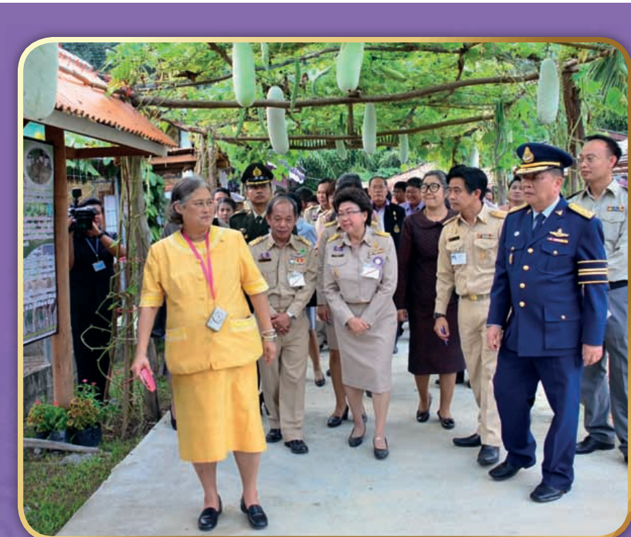
วันที่ ๒๒ - ๒๔ กันยายน ๒๕๕๗ สมเด็จพระเทพรัตนราชสุดาฯ สยามบรมราชกุมารี เสด็จพระราชดำเนินทรงปฏิบัติพระราชกรณียกิจ ณ ศูนย์ศึกษาการพัฒนาพิภพวิจิตร ชวนชม อ.นาหว้า จ.หนองบัวลำภู